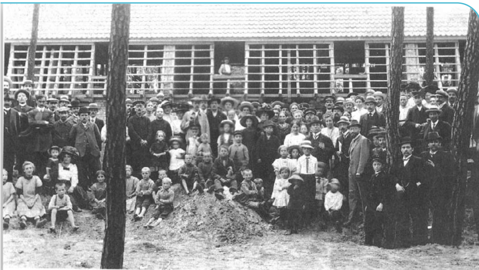
Die Gartenstadt-Familie vor dem ersten Bauvorhaben an der Waldpforte 1912.

Im Oktober 1912 wurden die ersten Einfamilienhäuser auf dem von der Stadt Mannheim im Erbbaurecht überlassenen Waldgelände bezogen. Hierzu zählen die Häuser in der Waldpforte 2-10. Diese Häuserreihe ist also der Anfang der Gartenstadt-Genossenschaft, welche im Jahre 1953 zur Gartenstadt-Genossenschaft geworden ist. Und sie steht immer noch.