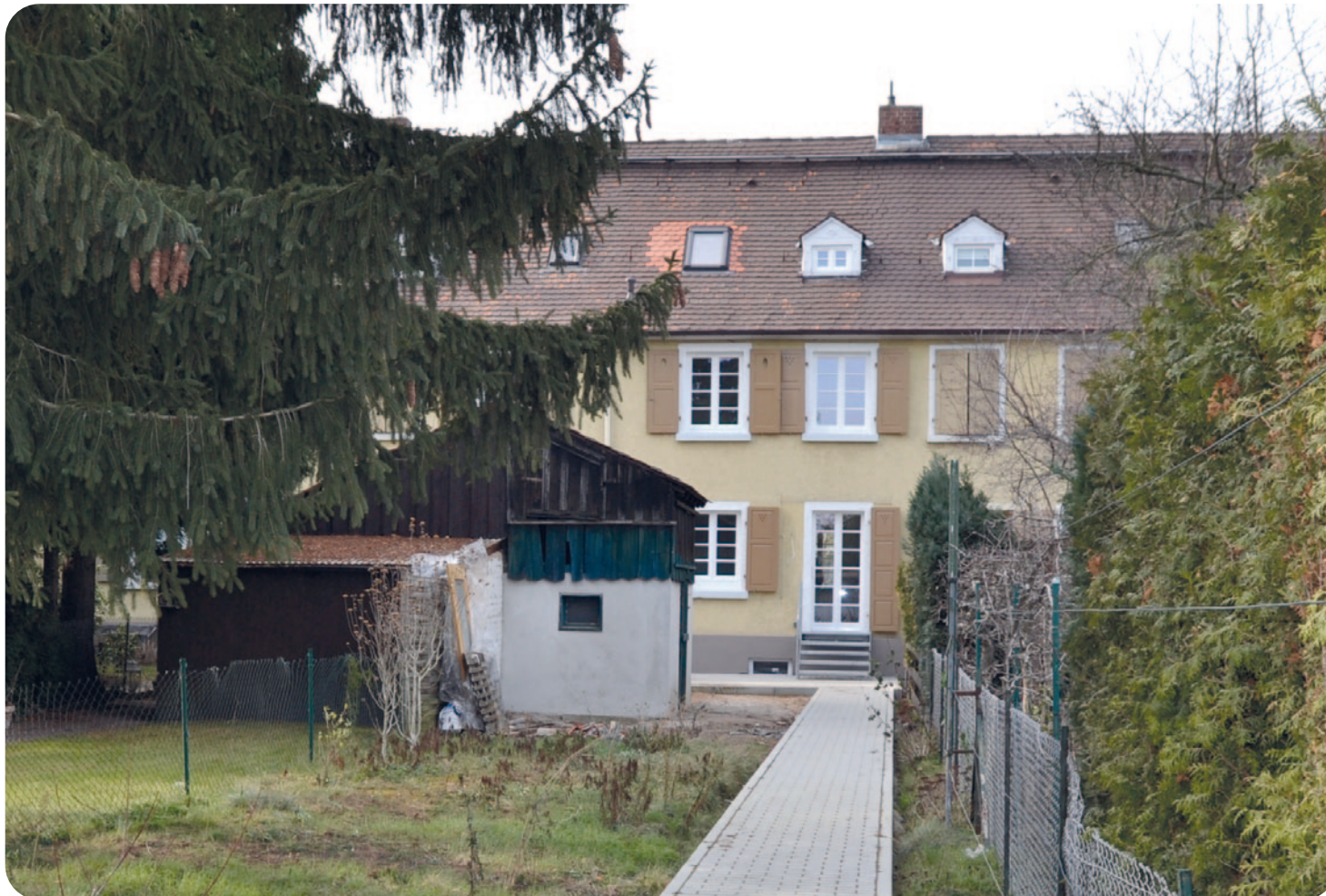
Mannheim-Gartenstadt, Unter den Birken 10, Gartenseite